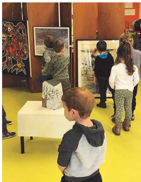
Les maternelles de Fleurance Lacrouz qui parcourent l'exposition en leur école.