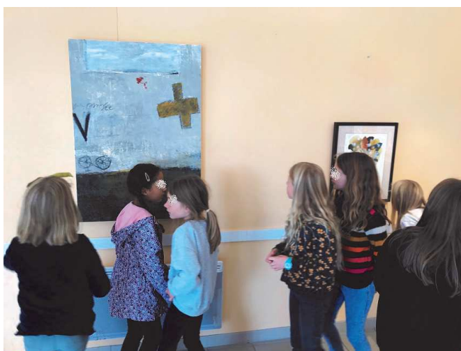
Les élèves de Montégut qui parcourent l'exposition en leur mairie.