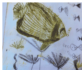
Gravure d'élèves de la mat au CM